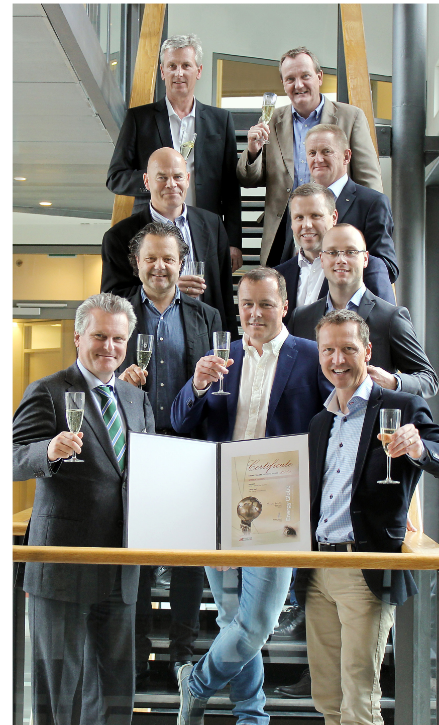
Free Energy teamet feirer utmerkelsen Energy Globe Award

den nye hybridløsningen er den mest moderne og den ræste varmepumpen på markedet.