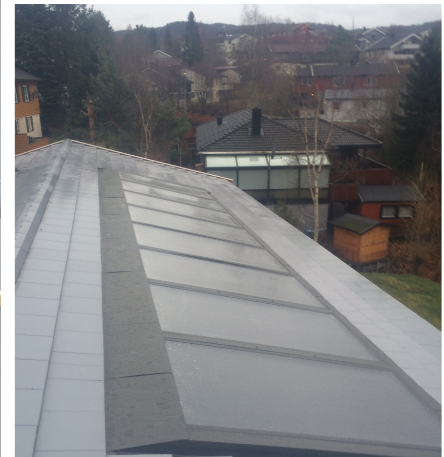
Takintegreert solfangerinstallasjon til HYSS-system i Trondheim

Markedet for HYSS i Europa (solceller ikke medregnet) er i størrelsesorden 2 milliarder Euro per år.